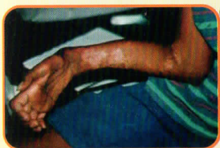
Volkmann's contracture, (tangan menjadi kaku, mengecil dan tidak berfungsi)