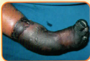
Khaki membiru dan membusuk karena penanganan tidak baik (harus diamputasi)