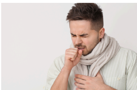
Batuk kering atau basah yang menghasilkan sputum berbusa