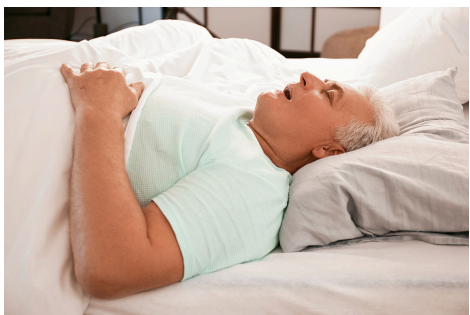
Ortopnea: kesulitan bernafas saat berbaring