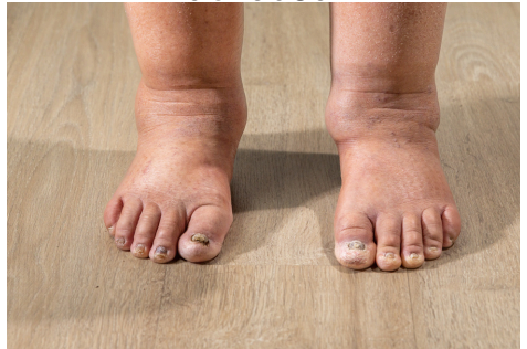
Pembengkakan pada kaki