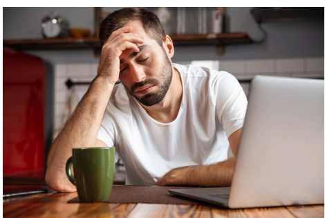
Mudah lelah akibat cairan jantung yang berkurang