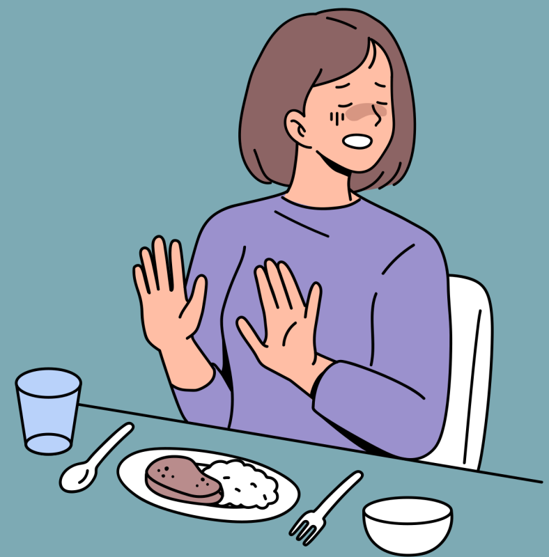
Nafsu Makan Turun